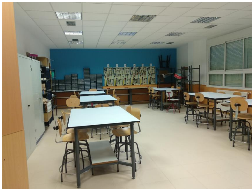
Taller de Tecnología